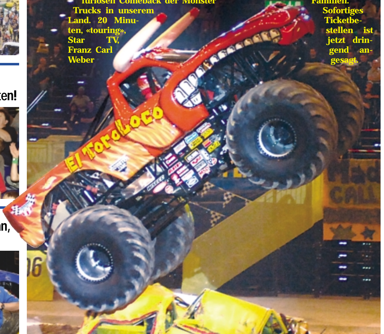
Seit 2001 ist El Toro Loco auf der Monster-Jam-Tournee die Riesensensation. Ein verrückter Stier verückt alle.

Sofortiges Ticketbestellen ist jetzt dringend angesagt.