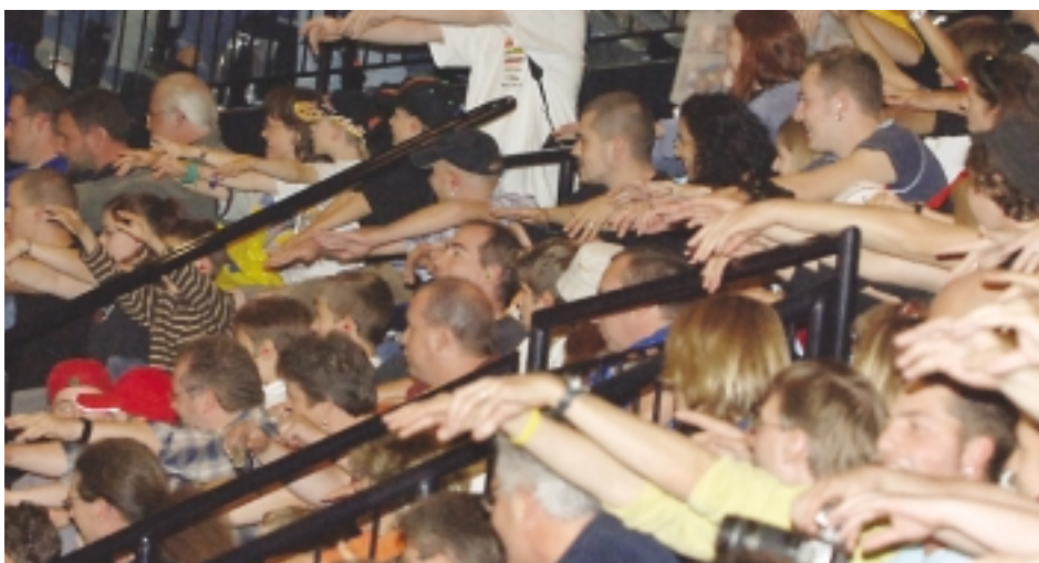
Liebe auf den ersten Kickdown. Die Schweizer Monster-Jam-Fans gelten als die lautesten weltweit.

«Nirgendwo auf der Welt sind die Fans enthusiastischer als in Zürich», sagt Madusa alias Debra Micelli. «Die 8000 Fans in einer Show waren jeweils noch lauter als die 1800 PS unter meinem Hintern, trotz Schallschutzhelm», verrät die Megamotorverrückte aus Florida. Die Begeisterung des Publikums ist für die Piloten wie ein Kickdown aufs Adrenalinpedal. «Je stärker die Fans auf den Rängen mitgehen, desto mehr lassen wir es auf dem Rennparcours krachen. Es ist wie ein Rausch. Gag it, heisst das für uns. Bleifuss drauf, die Maschine wird geknebelt.»