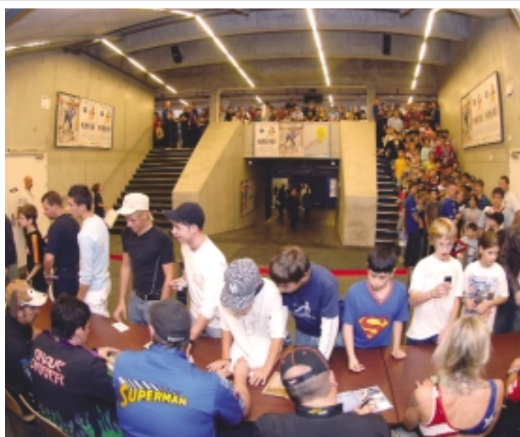
Stundenlang dauert die Aftershow: Für ihre Fans geben die Monster-Piloten alles.