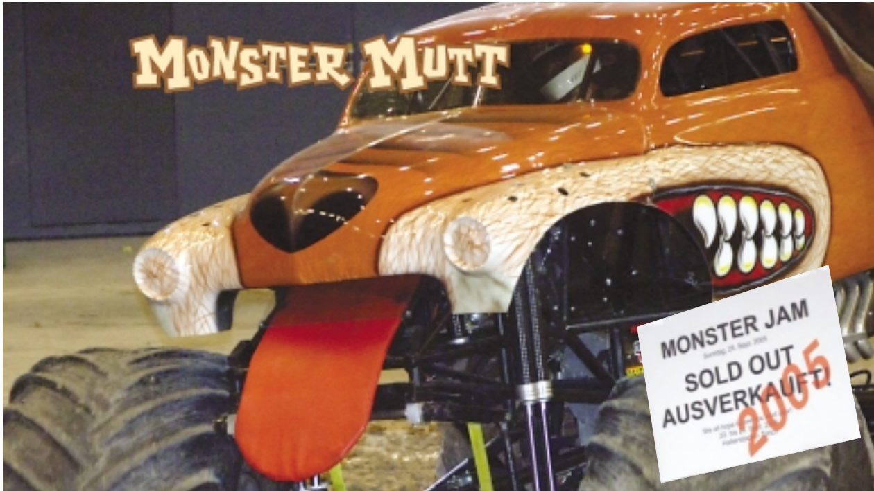
Der Monster-Köter zeigt die Monster-Zunge: All denen, die ihre Tickets zu spät bestellt hatten. 2005 waren die Shows restlos ausverkauft.